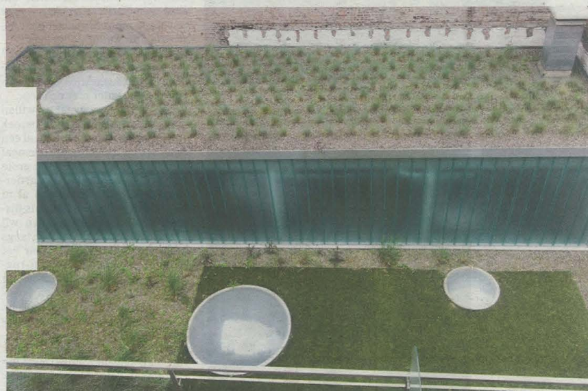
Op het dak bovenop het atelier werd een 'tuin' ingericht die verlicht wordt door de koepels.

De collegemuren rondom de opgelifte tuin creëren een knus binnengebied