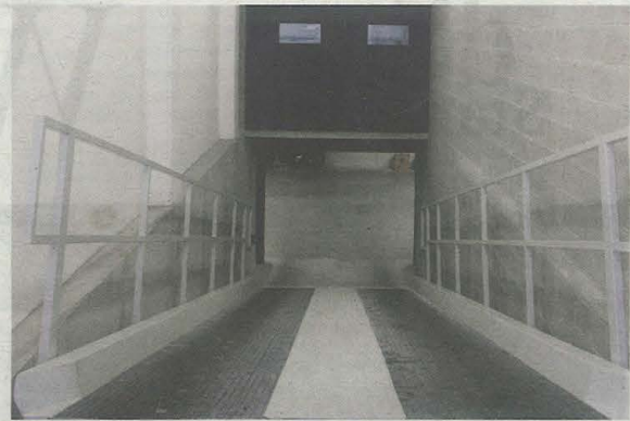
Via een ingenieuze helling kies je of je het atelier dan wel de garage eronder binnenrijdt.