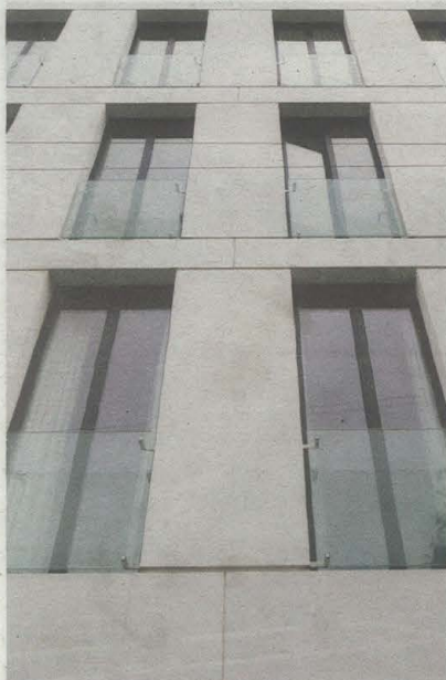
De voorgevel verwijst subtiel naar de late art deco waarin het naastgelegen college is opgetrokken.

Van riante herenwoning naar compacte flat, Walter en Fabienne De Vries gingen dan misschien letterlijk om de hoek wonen, het contrast kon niet groter zijn. Hoge plafonds en subtiele verwijzingen naar de vorige eeuw maakten de overstap minder bruusk.