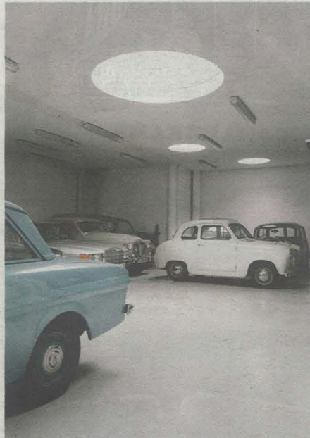
Het atelier met de oldtimers van Walter kan gemakkelijk een andere bestemming krijgen.