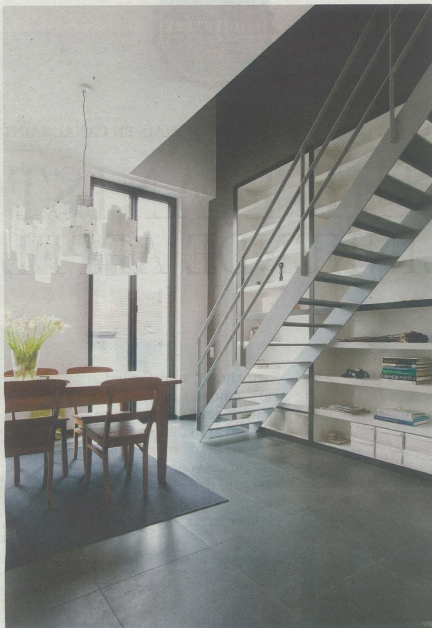
De hoge plafonds en ramen geven het interieur, ondanks de beperkte oppervlakte, een ruim gevoel.